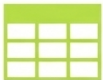
Tableau des imprévus: Listez les imprévus possibles dans votre sport (météo, équipement cassé, adversaire inattendu) et écrivez une solution potentielle pour chacun.